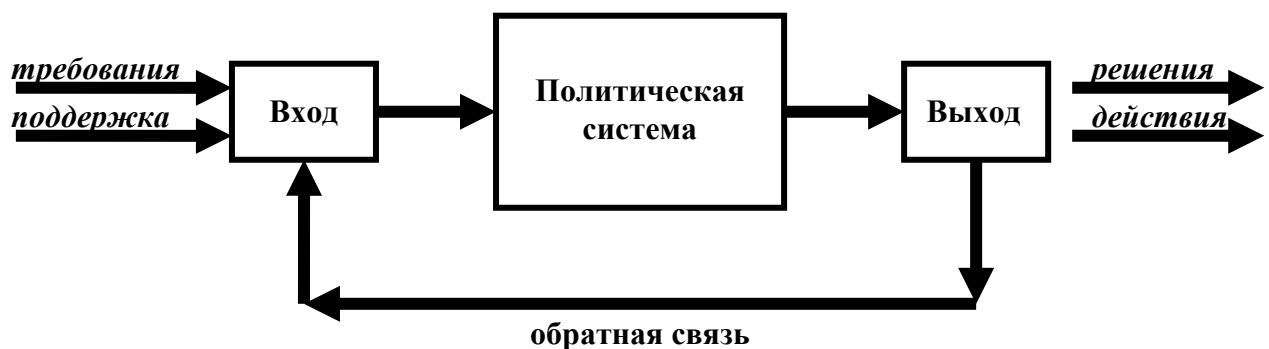
Политическая система по Д. Истону

Политическая система — совокупность различных политических институтов, социально-политических общностей, их форм взаимодействий, в которых реализуется политическая власть. Структура политической системы включает в себя: политическое общество, то есть государство, его политический режим и форму правления; гражданское общество и его взаимодействие с государством; политические партии и партийную систему. Методы изучения политической системы зависят от различных теоретических обоснований. Например, системный подход Д. Истона объясняет функционирование политической системы как взаимовыгодное взаимодействие государства и гражданского общества.