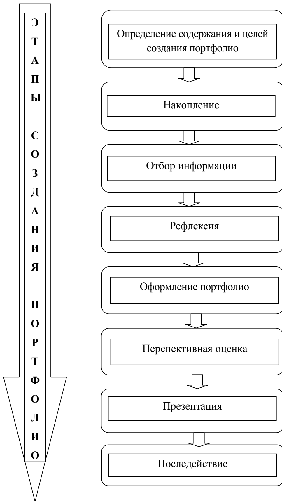
Рис. 6. Этапы создания портфолио