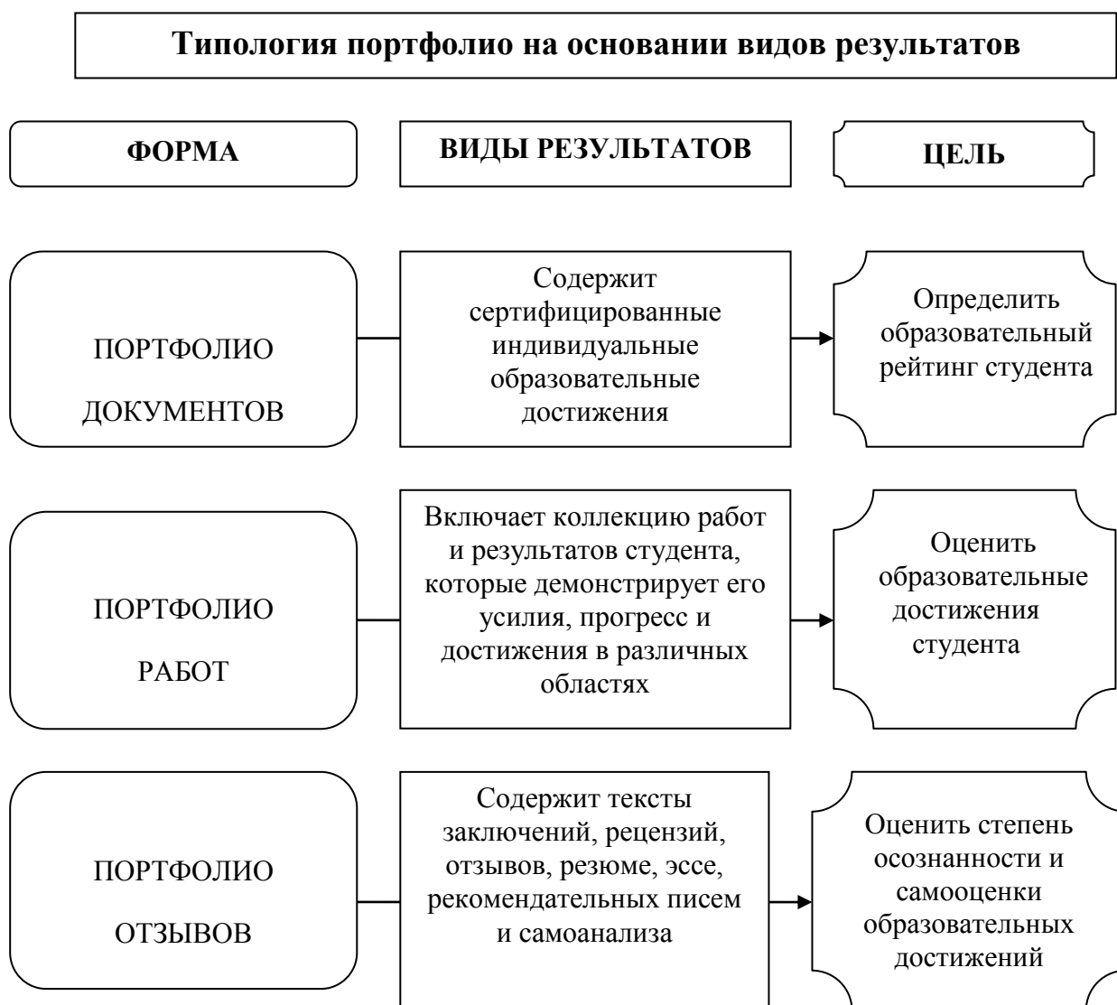
Рис.5. Типология портфолио на основании видов результатов

Представляется в виде текстов заключений, рецензий, отзывов, резюме, эссе, рекомендательных писем и прочее.