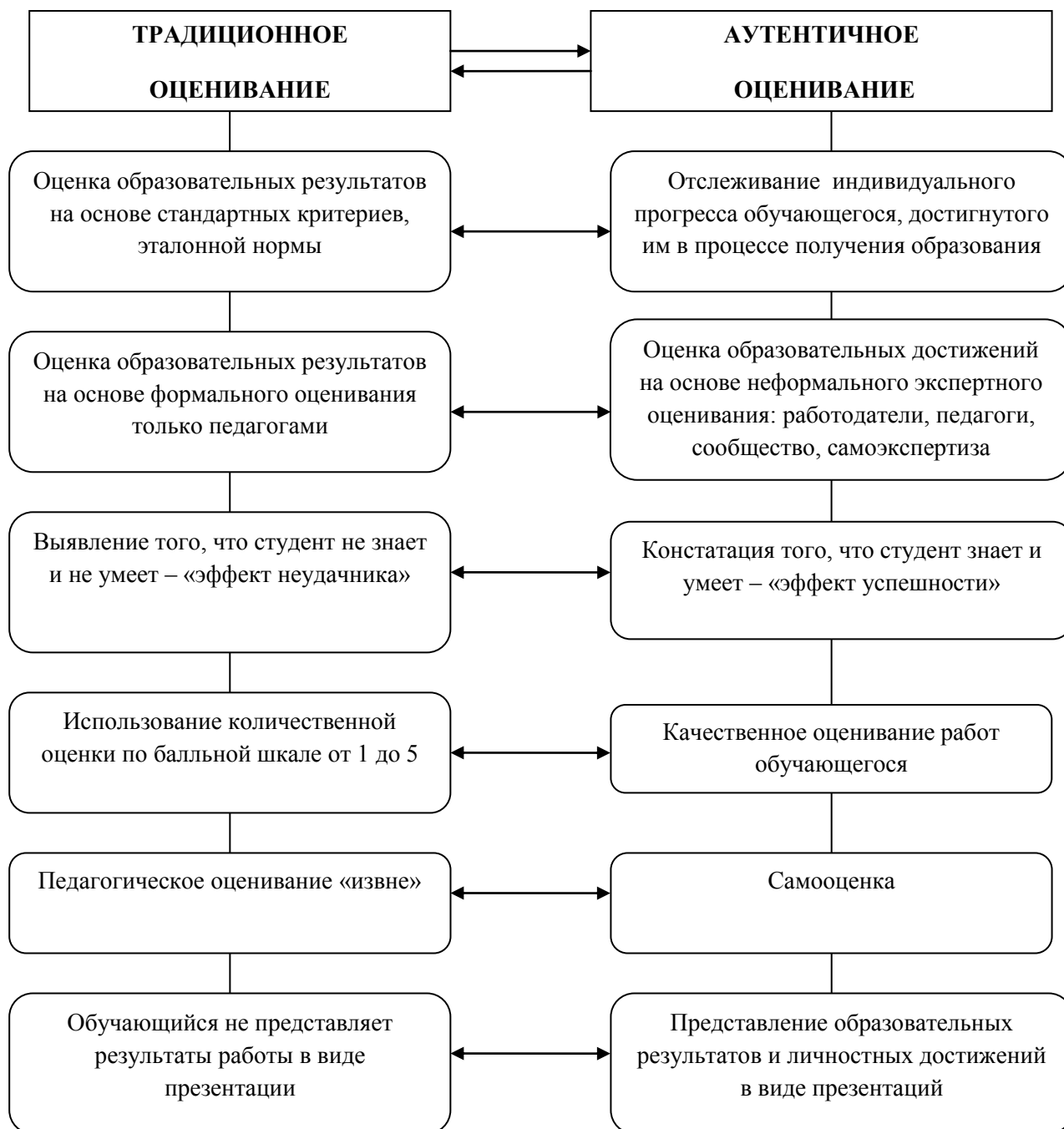
Рис.1. Сравнительный анализ традиционного и аутентичного оценивания