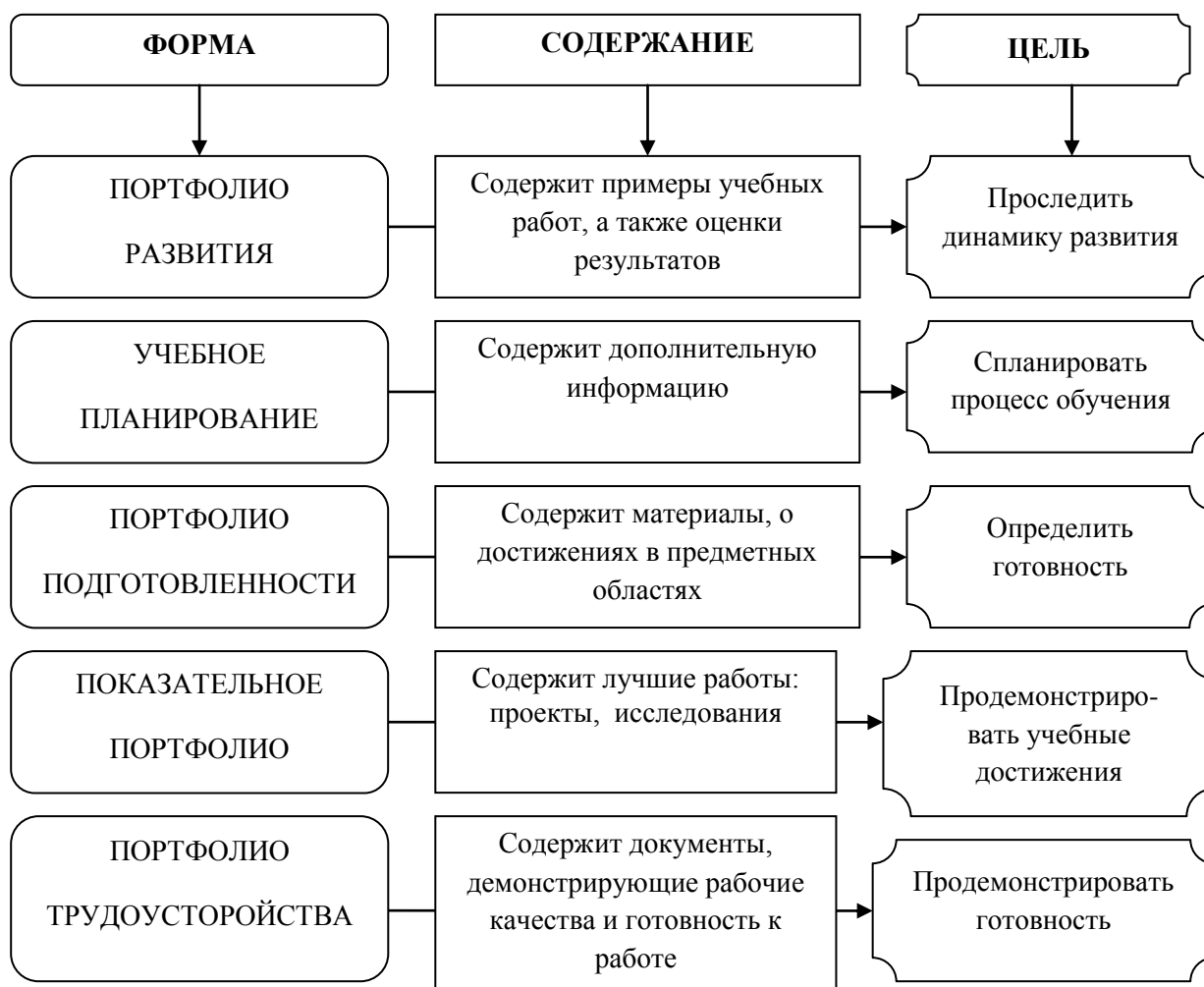
Рис. 4. Типология портфолио на основании целей использования

В нашем случае, портфолио студента для государственной итоговой аттестации интегрирует в себе все названные цели и, следовательно, в структуре портфолио должно быть отражено содержание названных типов портфолио, возможно, в качестве разделов.