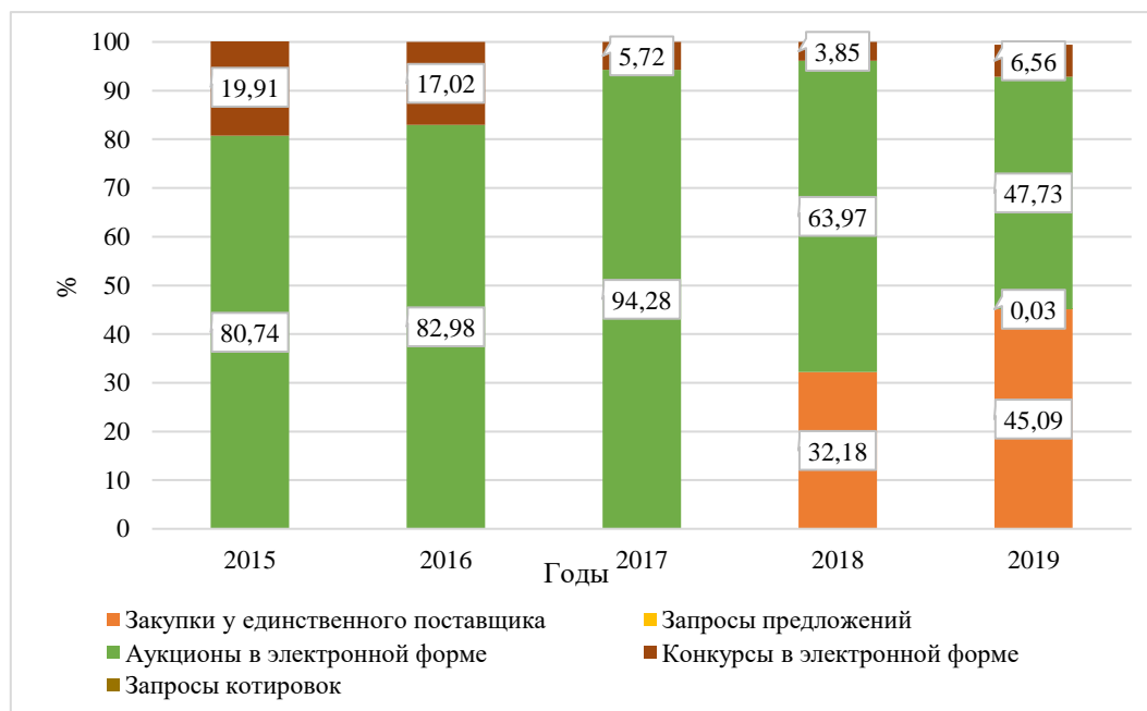
Рисунок 2. Динамика и структура государственных закупок, осуществляемых Федеральной таможенной службой, по их формам в 2015–2018 гг., % Построено авторами на основе данных [1, 4]