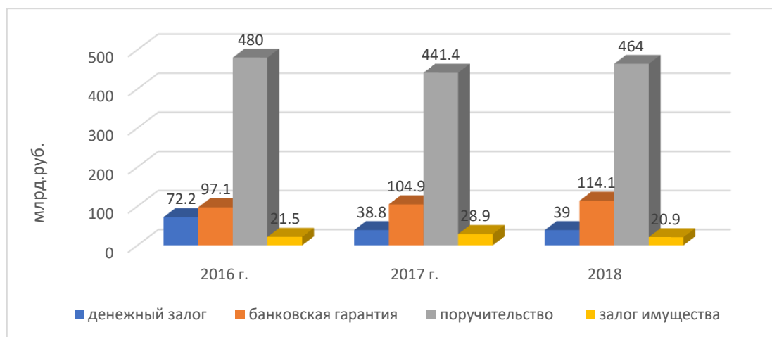
Рисунок 3. Динамика сумм, принятых по каждому из способов ОИУТП в ФТС в период 2016–2018 гг., млрд. руб. (составлено автором на основе отчетов ФТС России)

Проанализируем динамику изменения сумм, принятых по каждому из способов обеспечения исполнения уплаты таможенных пошлин, налогов на уровне ФТС России в период 2016–2018 гг. (Рисунок 3). Известно, что таких способов четыре: банковская гарантия, поручительство, денежный залог, залог имущества.