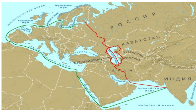
Рис.2 Проект международного транспортного коридора «Север-Юг»

Страны ЕАЭС заинтересованы в развитии данного маршрута, т.к. его функционирование «облегчит» доступ товаров не только на рынок Ирана, но и в Индию, и другие страны Персидского залива и Юго-Восточной Азии.